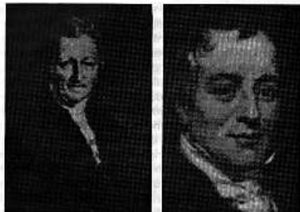
Malthus (1766-1834) e Ricardo (1772-1823).

ses estruturais e de transformações revolucionárias. Essa maturidade seria dada pela tendência do capital à sua concentração e à eliminação do princípio original que assistira a suas origens: a concorrência. O capital terminaria em mãos de poucos, constituindo o cume de uma pirâmide absolutamente separada da base. O capital terminaria por constituir oligopólios que derivariam em monopólios, até que tudo acabaria concentrando-se em uma única mão. Simultaneamente, a "base", sustentada pelo trabalho, pela "força de trabalho", iria alargando-se horizontalmente, crescendo em proporções imensas e aplicando a "lei de bronze dos salários". Marx constatou que o proletariado sofria uma progressiva depauperização, proporcional à concentração monopolista do capital. Somente invertendo-se a pirâmide seria possível impedir a