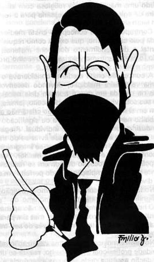
Max Weber (1864-1920)

Em A ética protestante e o espírito do capitalismo Weber começa investigando os princípios éticos que estão na base do capitalismo constituindo o que ele denomina o seu "espírito". E tais princípios são encontrados na teologia protestante, mais especificamente na teologia calvinista. A partir daí formula sua hipótese básica de trabalho, segundo a qual a vivência espiritual da doutrina e